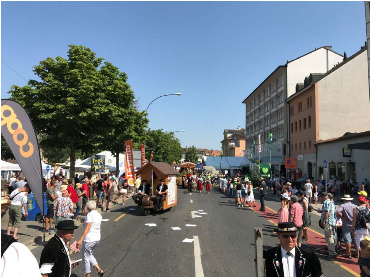
Mit dem Drürad-Werbewägeli macht der Jodlerklub Passwang Mümliswil an allen drei Unterverbands-Jodlerfesten im 2018 Werbung. Foto aus Yverdon les Bains.