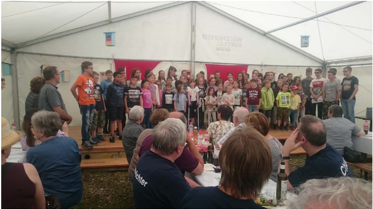
Gesamtchor Schnupperweekend 2018