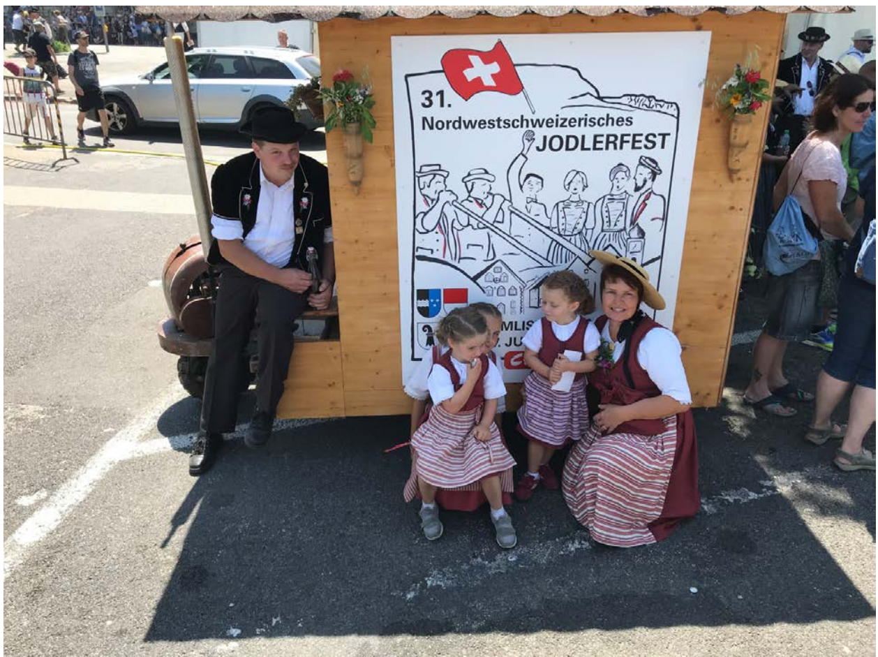
Jung und Alt sind eingeladen am 31.NWSJV-Jodlerfest in Mümliswil-Ramiswil